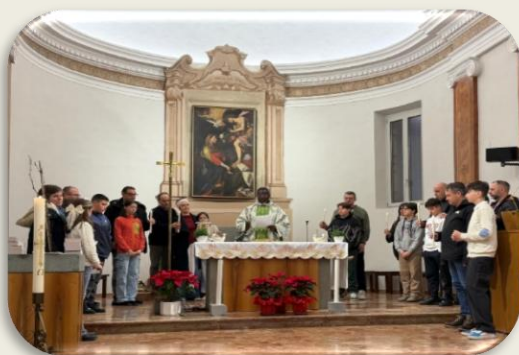
Rinnovo delle promesse battesimali dei cresimandi a Vezia