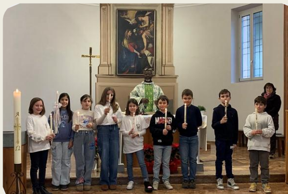
Rinnovo delle promesse battesimali dei bambini che si preparano alla Prima Comunione a Vezia, 25 gennaio 2026