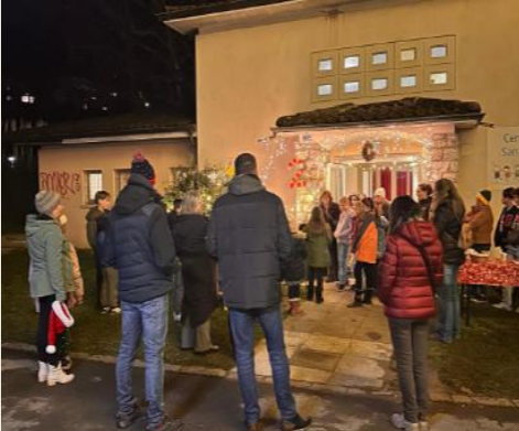
20 dicembre – finestra dell'Oratorio