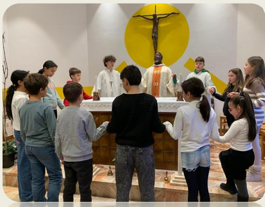
Rinnovo delle promesse battesimali dei bambini che si preparano alla Prima Comunione a Savosa, 24 gennaio 2026