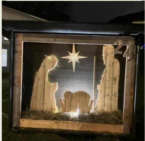
24 dicembre: finestra della Parrocchia