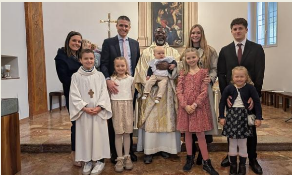
Il battesimo, festa in famiglia